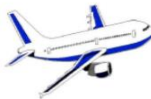
Самолёт гудит: У-У-У