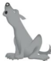
Волк воет: У-У-У