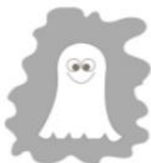
Привидение летает и воет: У-У-У