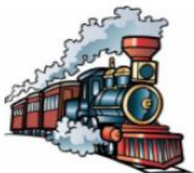
Поезд гудит: У-У-У