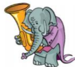
Слон трубит: У-У-У