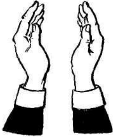
Ладони раскрыты поменьше.